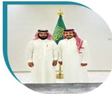
زيارة الإعلامي: سلطان الهميلي